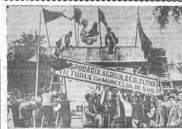
Крестьян села Мунчелу де Сус, Романовского уезда (Румыния) объединил в колхоз «Виктория» («Победа»). НА СНИМКЕ: группа крестьян устанавливает доску с названием своего колхоза.

Трудящиеся Павловска свято чтут память о героях гражданской войны, отдавших жизнь в борьбе за власть Советов. В районном центре реставрируется памятник 38 партизанам, героически погибшим в боях с колчаковскими бандами. Возведен новый обелиск, на одной из граней которого будут начертаны имена партизан-героев. Сегодня памятник павловским партизанам будет открыт.