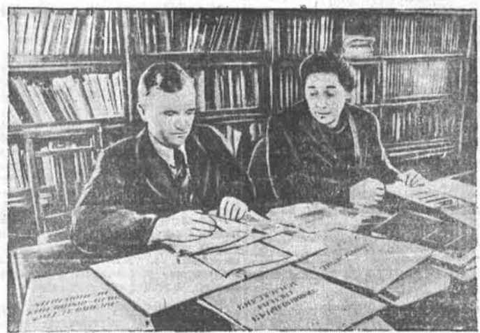
В ноябре исполняется 10 лет со дня смерти выдающегося советского учёного, основоположника травяной системы земледелия, академика В. Р. Вильямса. Московская сельскохозяйственная академия имени Тимирязева, где жил и работал учёный, готовится отметить эту дату.

Нынешним летом, участвуя в международных студенческих играх в Булаште, команда советских гимнастов заняла первое место. Советские гимнасты получили 22 золотых, 11 серебряных и 10 бронзовых медалей.