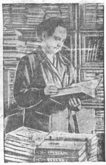
Трудящиеся нашего края охотно пользуются книгами из межбиблиотечного абонемента Алтайской краевой библиотеки. Они получают литературу по всем отраслям знаний.

20. Пленум крайкома партии обязывает Горно-Алтайский обком ВКП(б) и облисполком, райкомы партии, райисполкомы и первичные партийные организации развернуть массовое социалистическое соревнование среди колхозников, рабочих совхозов и всех работников сельского хозяйства края за успешное выполнение постановления Совета Министров Союза ССР и ЦК ВКП(б) о трёхлетнем плане развития общественного колхозного и совхозного продуктивного животноводства.