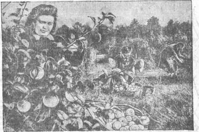
НА СНИМКЕ: сбор яблок на Барнаульской экспериментальной базе Алтайской зональной плодово-ягодной станции.

В ресторан ст. Барнаул — опытный зам. гл. бухгалтера, знакомый с общепитом и торговлей. Обращаться: ул. 12-я Алтайская, 5, к гл. бухгалтеру.