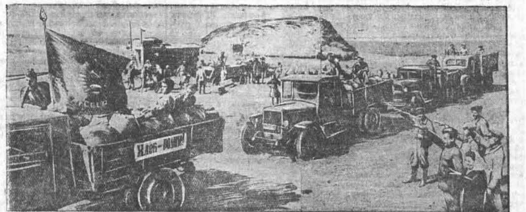
НА СНИМКЕ: автоколоса с хлебом отправляется с тока первого отделения совхоза на элеватор.