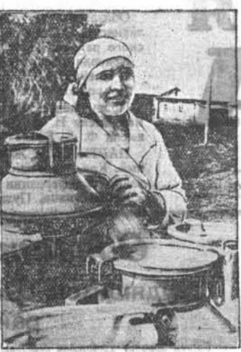
Колхоз «Сибиринск». Рубновского района, полностью рассчитался с государством по молокопоставкам.

Вот умение же люди хорошо работать, говорят в райдротделе. — Если бы во всех районах так относились к делу, край имел бы замечательные проезжие пути.