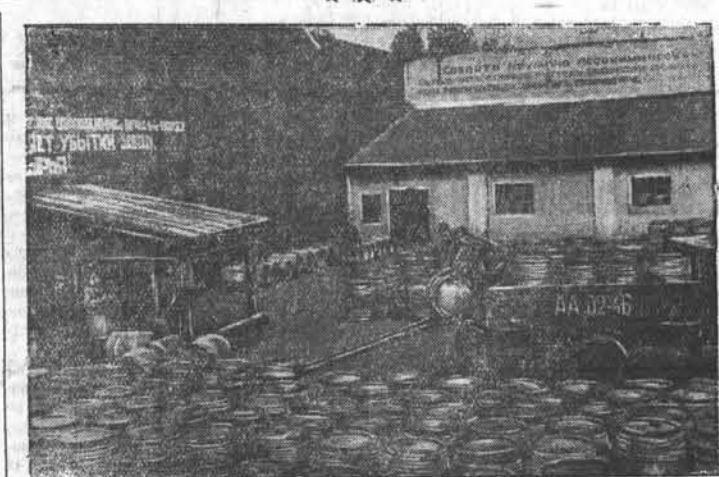
Десятки тонн живицы ежедневно перерабатывает барнаульский каннфольно-терпентинный завод. Июльскую программу коллектив предприятия перевыполнил. НА СНИМКЕ: приёмка живицы на заводе.