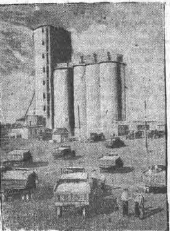
Ростовская область. Широко развернулась уборка урожая в зерновом совхозе «Гигант» Сальского района. Только в первые три дня массовой уборки было убрано 3.400 гектаров. В совхозе механизированы все основные уборочные работы. В этом году впервые весь хлеб убирается самоходными комбайнами. Здесь работает 100 таких машин. Погрузка зерна на автомашин производится 12 зернопогрузчиками. На транспортнике хлеба занято 25 трёхтонных автомашин. НА СНИМКЕ: автомашинный совхоз «Гигант» доставил на Трубецкой элеватор зерно нового урожая.

Зверем Вас, дорогой Иосиф Виссарионович, что мы прилагаем все наши силы, опыт и знания и добьёмся почетного права первыми среди восточных областей и краев рапортовать Вам о досрочном выполнении трёхлетнего плана развития продуктивного животноводства.