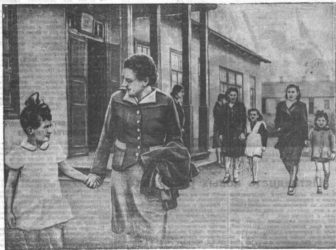
28 начальная школа Октябрьского района гор. Барнаула полностью подготовлена к началу учебного года. Сейчас здесь идёт запись учащихся.