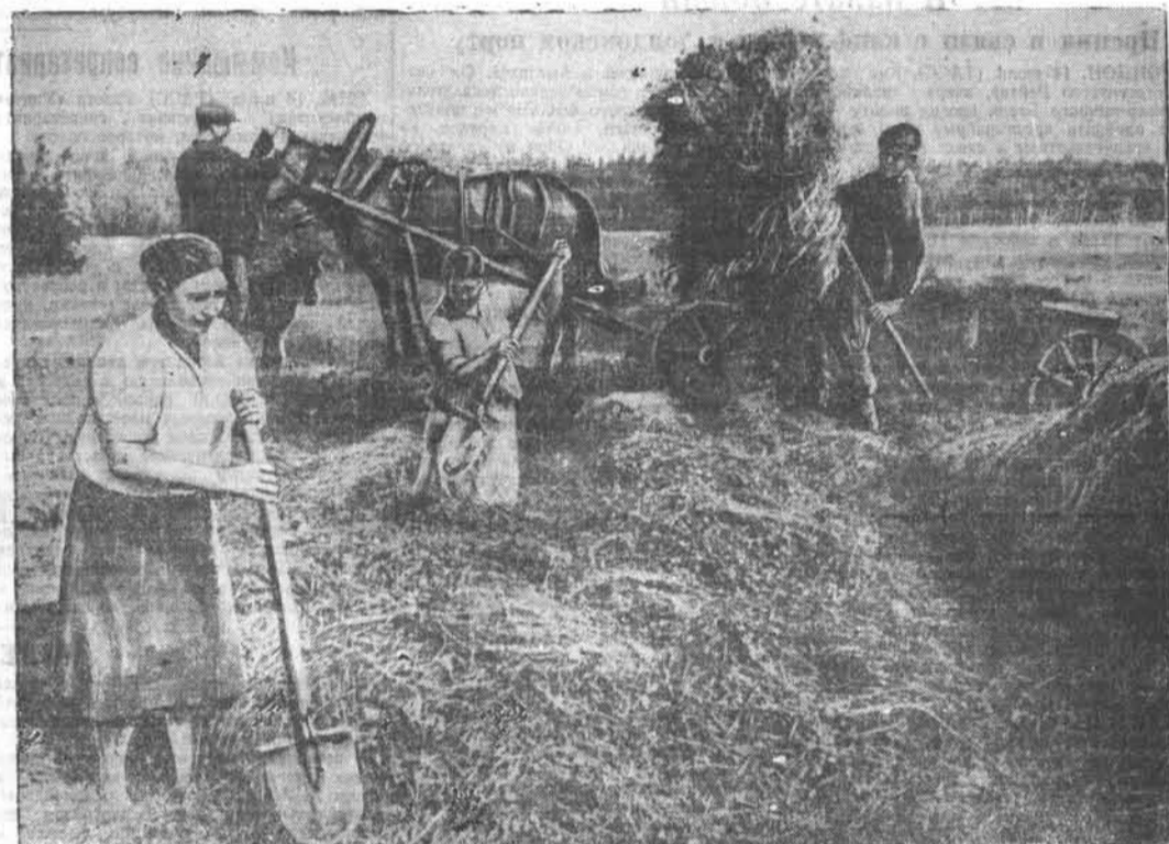
Колхозники сельхозартеля «Строитель», Калманского района, выполнили план силосования на 95 процентов. НА СНИМКЕ: закладка силоса в колхозе «Строитель».