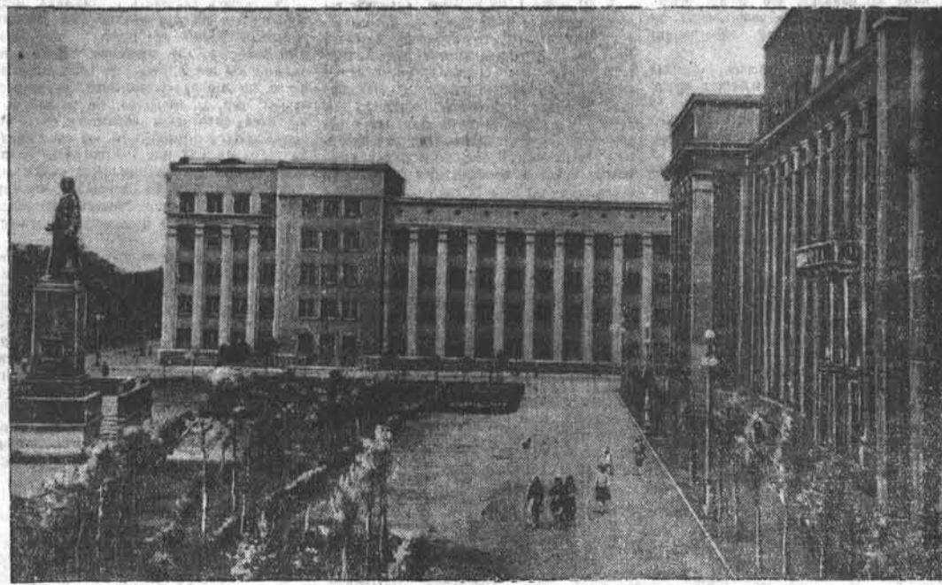
НА СНИМКЕ: площадь Свободы в столице Северо-Осетинской АССР — Дзауджикау.

По примеру сельхозартели Булатовского сельсовета к строительству гидроэлектростанции приступили колхозы имени Орджоникидзе, Тумановского сельсовета, и «Новый мир», Медвековского сельсовета.