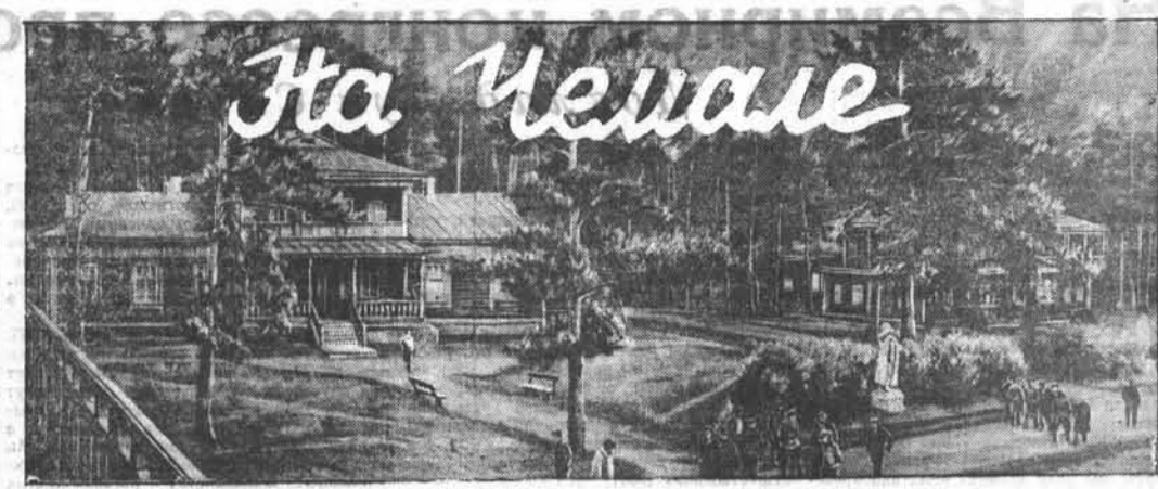
На снимках: сверху: курорт Чемаля. Внизу — река Чемаля при впадении в Катунь.

Согласно утвержденному плану, колхозы Залесовского района должны построить в нынешнем году 380 жилых домов, 35 типовых зерносушилок, десять домов для учителей, пять кирпичных заводов, школы, избы-читальни, клубы. Более ста объектов должны строиться из кирпича и самана. Все колхозы обеспечены типовыми проектами. Отдельные сельхозартели активно принялись за реализацию плана. В колхозе имени Анатолия строится школа, три жилых дома для колхозников, типовая зерносушилка. В колхозе «Завет Ленина» — два дома, зерносушилка, новый свинарник. Всего колхозы соорудят около ста различных построек. Однако в целом по району строительство идет медленно. Богатейшие залежи глины не используются, производство кирпича и самана не налажено. Из пяти запланированных кирпичных заводов строится только один — в колхозе «Восход», Ново-Лузинского сельсовета. Сельхозартель «Путь большевика», «Память Куйбышева», «Льновод» и другие откладывают строительство кирпичных заводов. Более того, эти артели не ведут никаких подготовительных работ. Строительные бригады здесь не созданы. П. СИНЦИН, техник-строитель.