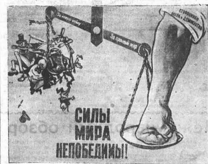
Плакат работы художников Б. ЕФИМОВА и Н. ДОЛГОРУКОВА

В заключение исполком компартии заявляет, что только проведение политики, отвечающей этим требованиям, может предотвратить кризис и войну.