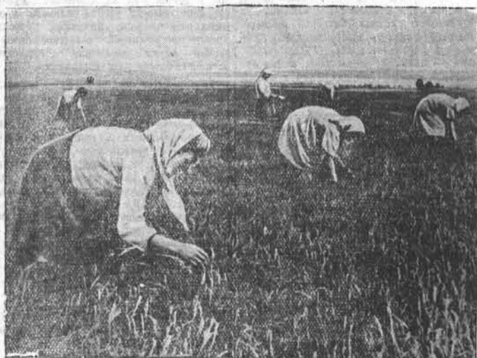
Хорошая пшеница растёт на полях колхоза «Труд Ленина», Барнаульского сельского района. Колхозники старательно ухаживают за посевами. НА СНИМКЕ: члены бригады тов. СУЛЬДИНА на прополке посевов.

25.000 рублей, 1130 по 10.000 рублей, 2260 по 5.000 рублей, 22600 по 1000 рублей, 226.000 по 500 рублей и 1.696.582 выигрыша по 200 рублей. Тираж будет проведен в Днепрпетровске. (ТАСС).