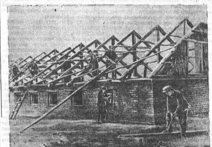
Колхозники сельхозартеля имени Серго Орджоникидзе, Алейского района, строят клуб, скотный двор, молочноперерабатывающий завод, детские ясли, конюшню, спортивную площадку и типовую телятник. Кирпич для стройки изготавливается на своем заводе.

В обязанность этих учреждений входит составление планов сельского и колхозного строительства, разработка правил планировки и застройки населенных мест. Они должны намечать мероприятия по организации и улучшению строительства и капитального ремонта жилых домов, коммунальных и административных зданий, школ, больниц и других культурно-бытовых построек на селе, а также производственных объектов в колхозах.