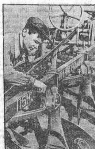
Инженеры и станководы завода «Алтасельмаш» ведут большую работу по усовершенствованию многокорпусных тракторных плугов.

Тридцатилетие завода. Приближается 30-летний юбилей Барнаульского станкостроительного завода. 4 июля 1919 года его плечи выдал первую продукцию. В начале Великой Отечественной войны, по решению правительства, предприятие было перенесено на Алтай.