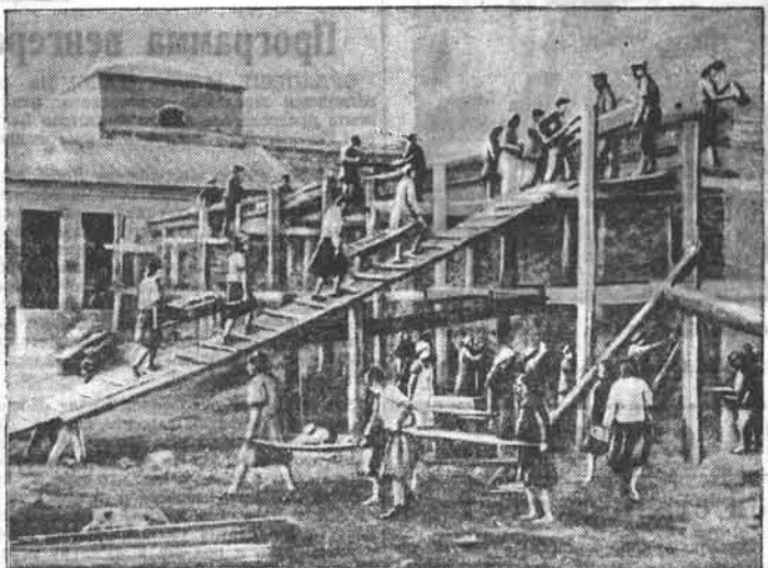
В селе Майма, Горно-Алтайской области, заканчивается строительство маслодельно-сыроваренного завода и холодильника. НА СНИМКЕ: строительная бригада за работой.