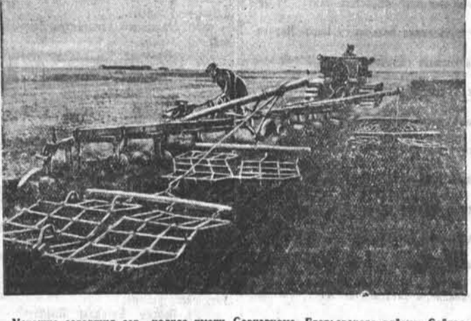
Успешно завершила сев колхоз имени Совнаркома, Егорьевского района. Сейчас тракторная бригада поднимает пары.