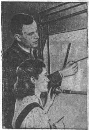
В цехах Алтайского тракторного завода растут ряды новаторов производства. Конструкторы отдела главного механика...

В текущем году нашему району оказана огромная помощь техники. Мы получили 18 новых тракторов АТЗ-НАТИ.