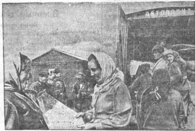
По всему Кулундинскому району курсирует автолавка райпотребсоюза. В лавке большой выбор товаров.

НА СНИМКЕ: автолавка у полевого стана колхоза «14 лет Октября».