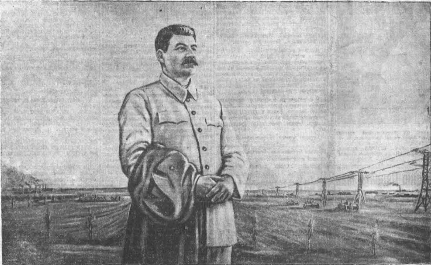
«Утро нашей Родины».

Под бурную овацию участники торжественного заседания приняли приветственное письмо великому Сталину.