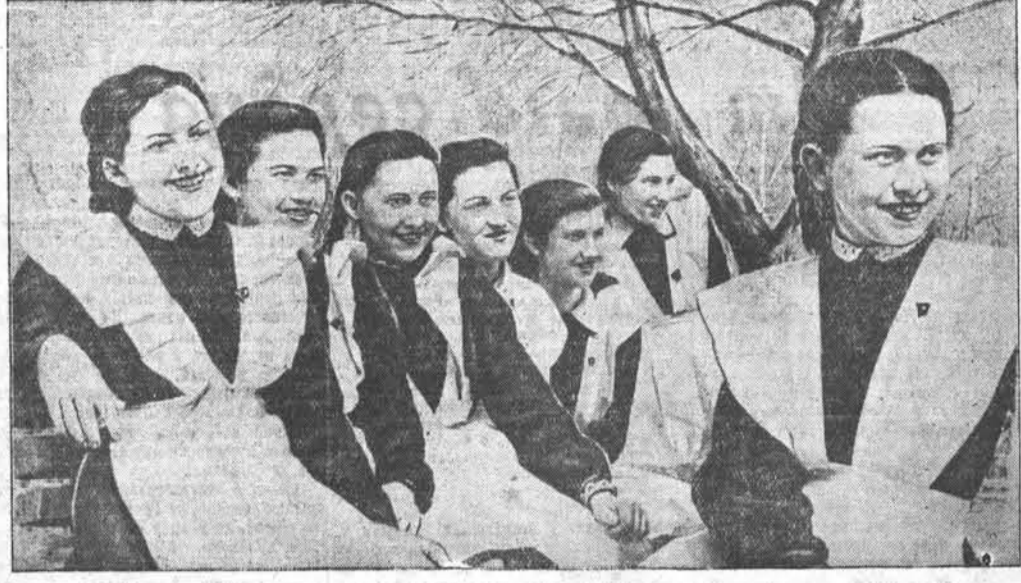
Радостно и весело встретили Первомай советская молодежь. Перед вами — барнаульские школьники. На их лицах играют улыбки. Они благодарны великому Сталину за счастливую и радостную юность.