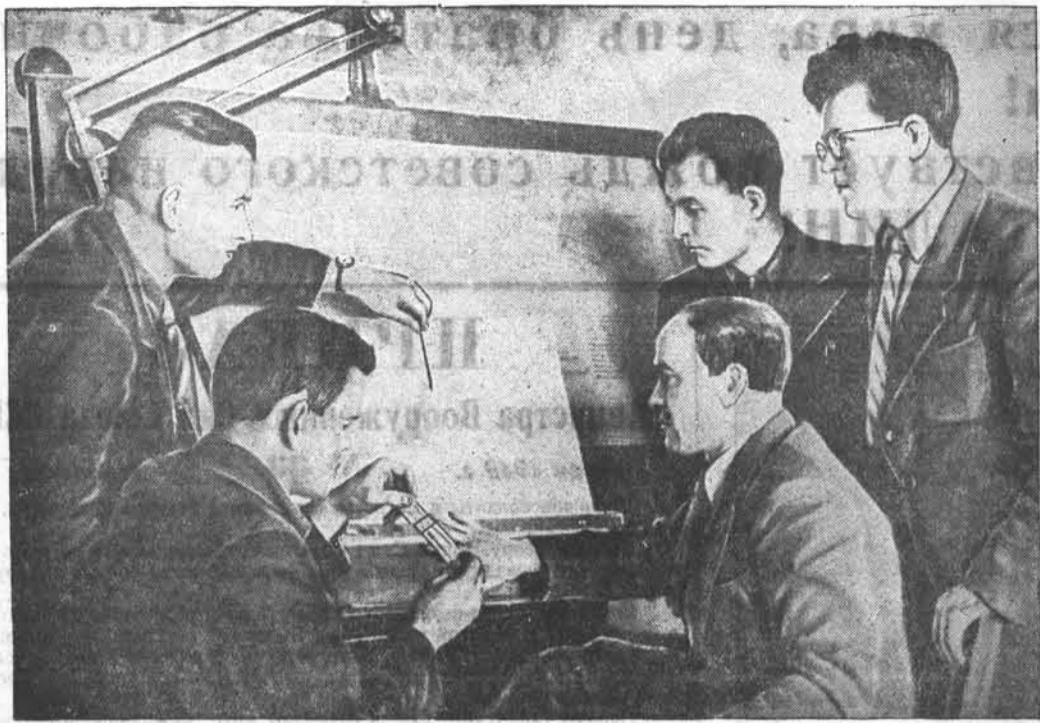
Замечательные плоды в нашей стране приносит содружество стахановцев и инженеров. На Барнаульском заводе транспортного машиностроения большую помощь конструкторам и технологом в создании новых типов дизельных двигателей, в совершенствовании их конструкций оказывают стахановцы.