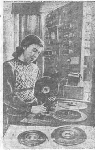
Ежедневно в эфир передаются концерты и монтажи спектаклей с участием ведущих мастеров искусства. Многие из них транслируются по радио в запись на тонких пластинах, которые создаются на фабрике звукозаписи Всесоюзного радиокомитета.

Крайсовпроф обратил особое внимание местных комитетов на проведение мероприятий по улучшению технологии производства и оказанию шефской помощи колхозам.