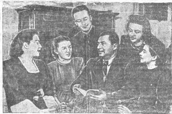
Поэт Александр ЖАРОВ среди комсомольцев краевого драматического театра.

Все претензии принимаются до 20-го марта 1949 года. ЛИКВИДКОМ. Утерянную круглую печать Листьянского рабочего комитета считать недействительной.