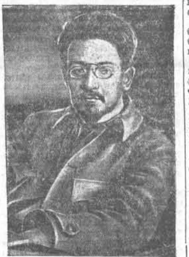
Яков Михайлович Свердлов

Падение героической советской партии, великий владыка Сталинский, неужели не видят в коммунизме, о котором горячо мечтал и за который отдал свою короткую, но яркую и кипучую жизнь Яков Михайлович Свердлов.