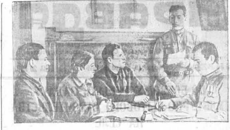
Коммунисты колхоза имени 25-тысячников, Рубовского района, настойчиво повышают свой идейно-политический уровень. НА СНИМКЕ: коммунисты за учебой.

В. МИТЮШКИН, секретарь Алтайского крайкома ВКП(б)