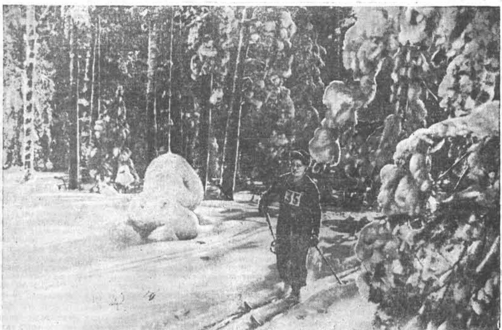
Фото-этиюд Н. Калинин.

Ордену Ленина заводу транспортного машиностроения — грузчики. Оплата сдельно-прогрессивная от 600 до 900 руб. в месяц.