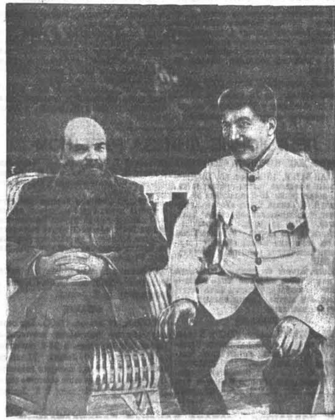
В. И. Ленин и И. В. Сталин в Горках (1922 г.).

Или — или, так египет вопрос. Величие Ленина и Сталина состояло в том, что они с силой, простиравшей подлинно великим духом, выразили новую задачу,