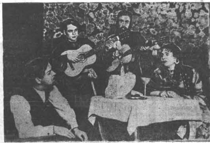
Сцена у цыган в спектакле «Живой труп».

«Толстой, — писал В. И. Ленин, — с огромной силой и полнотой бичевал господствующие классы, с великой наглядностью разоблачал внутреннюю ложь всех тех учреждений, при помощи которых держится современное общество: церковь, суд, милитаризм, «закононый брак», буржуазную науку».