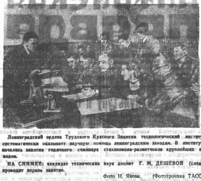
Ленинградский ордена Трудового Красного Знамени технологический институт систематически оказывает научную помощь ленинградским заводам. В институте начались занятия годичного семинара стахановцев-разметчиков крупнейших заводов.