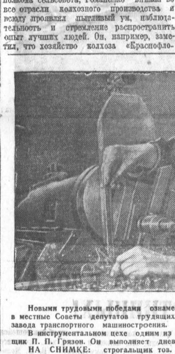
Новыми трудовыми победами ознаменовали всенародный праздник — выборы в местные Советы депутатов трудящихся рабочие Барнаульского округа Ленина завода транспортного машиностроения.