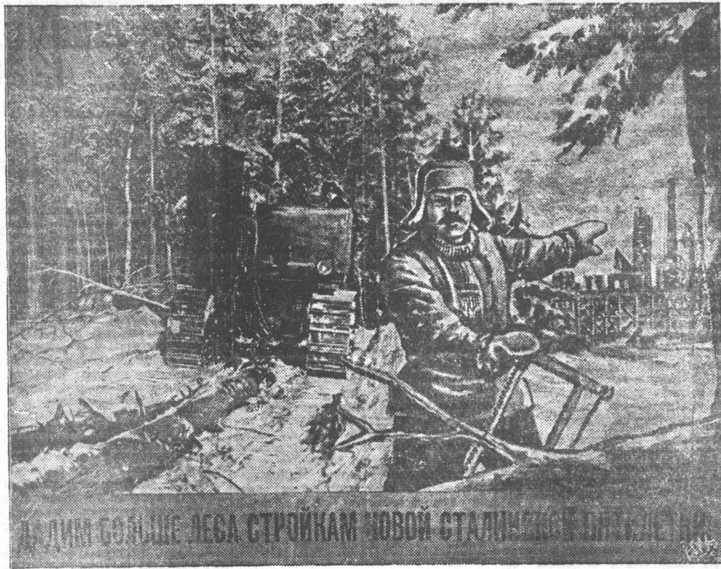
Вперед к победе в борьбе за выполнение государственного плана лесозаготовок

Обращение обсуждено и принято на собраниях рабочих, инженерно-технических работников и служащих коллектива Южакского мехлесопункта 18 ноября 1947 года.