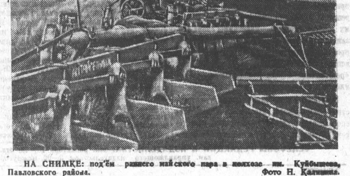
НА СНИМКЕ: подём раннего майского пара в колхозе им. Куйбышева, Павловского района.

В установленные сроки сдают молоко члены колхоза имени Куйбышева. По молокопоставкам от рабочих и служащих первое место в районе занимает Челкашский сельсовет.