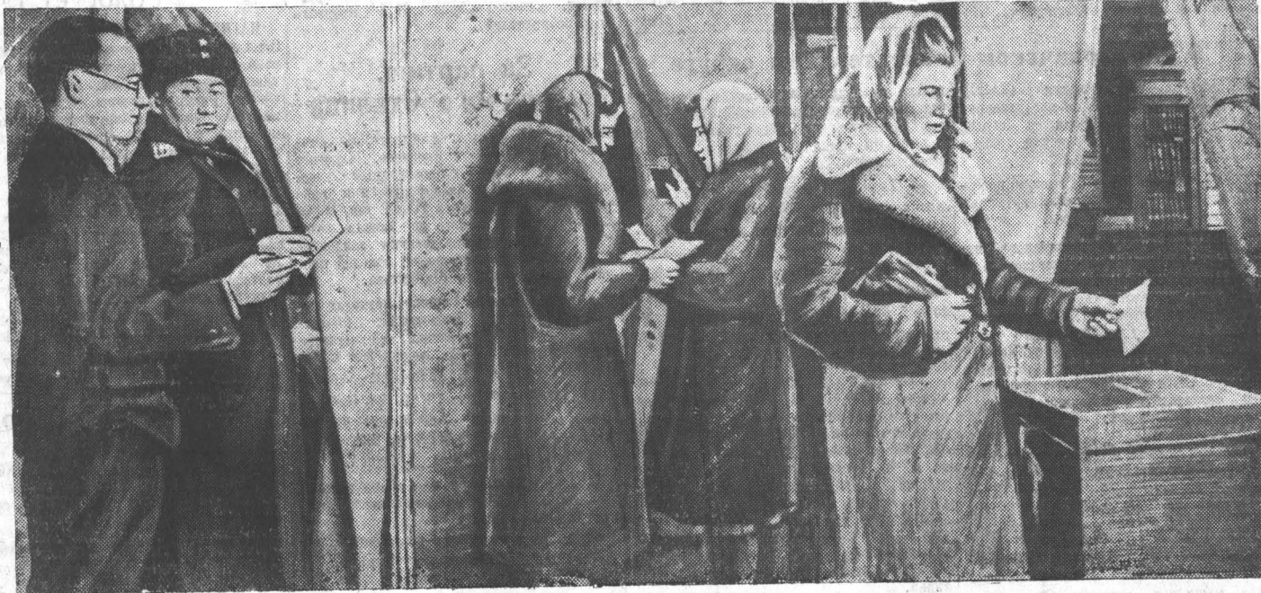
35 избирательный участок Барнаульского городского избирательного округа № 86 по работе и оборудованию признан одним из лучших в округе. НА СНИМКЕ: избиратели Железнодорожного района г. Барнаула голосуют за кандидата блока коммунистов и беспартийных на участке № 35.

— Сегодня мне выпало большое счастье отдать свой голос за товарища Сталина, — заявил он после голосования. — Вчера я стал на почетную вахту и смею надеяться выполнить на 300 процентов. Весь коллектив нашего предприятия работал в предвыборные дни с небывалым подъемом.