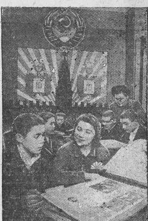
В агитпункте при Дворце культуры Московского автозавода имени Сталина. НА СНИМКЕ: молодые избиратели знакомятся с литературой, посвященной выборам в Верховный Совет СССР.

Школьные каникулы начинаются! Пожелаем нашим славным школьникам, нашим юным гражданам радостного, веселого, занимательного отдыха!