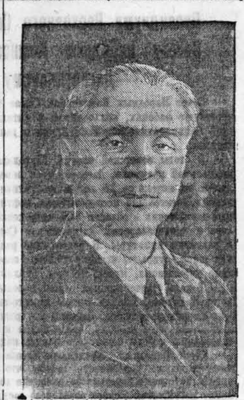
— один из самых передовых людей, один из замечательных гуманистов своего времени.

Все мы хотим только одного, чтобы на нашей сцене звучал подлинный Шекспир