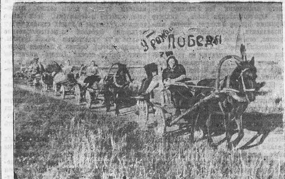
Колхоз «Красный кирпичник», Белевского района, Тульской области, досрочно выполнил свои обязательства перед государством по всем видам зерноуборочных и организаторов красной осы с хлебом сверх плана в честь Победы. НА СНИМКЕ: красный обоз направляется на сыпной пункт.