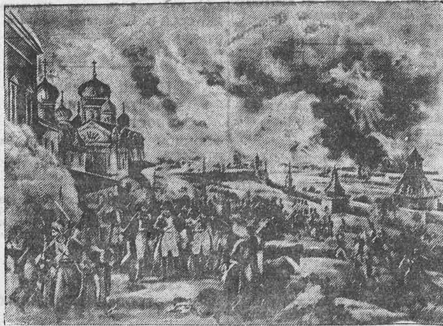
«Пожар в Кремле». Рисунок французского художника Фабера-дю-Фора. (По материалам Государственного Исторического музея в Москве).

«Пошлим ныне осеннее время наступит, через то движениям большому армией делаться совершенно затруднительными, наиболее с многочисленною артиллериею при ней находящеюся, то и решился я, — писал в те дни Кутузов, — избегая генерального боя, вести малую войну, ибо раздельные силы неприятеля и оплошность его покажут мне более способов истреблять его, и для того, находясь ныне в 50-ти верстах от Москвы с главными силами, отделил от себя немаловажные части в направлении к Можайску, Вязьме и Смоленску. Кроме сего вооружены ополчения Калужское, Рязанское, Владимирское и Ярославское, имеющие все свои направления к поражению неприятеля».