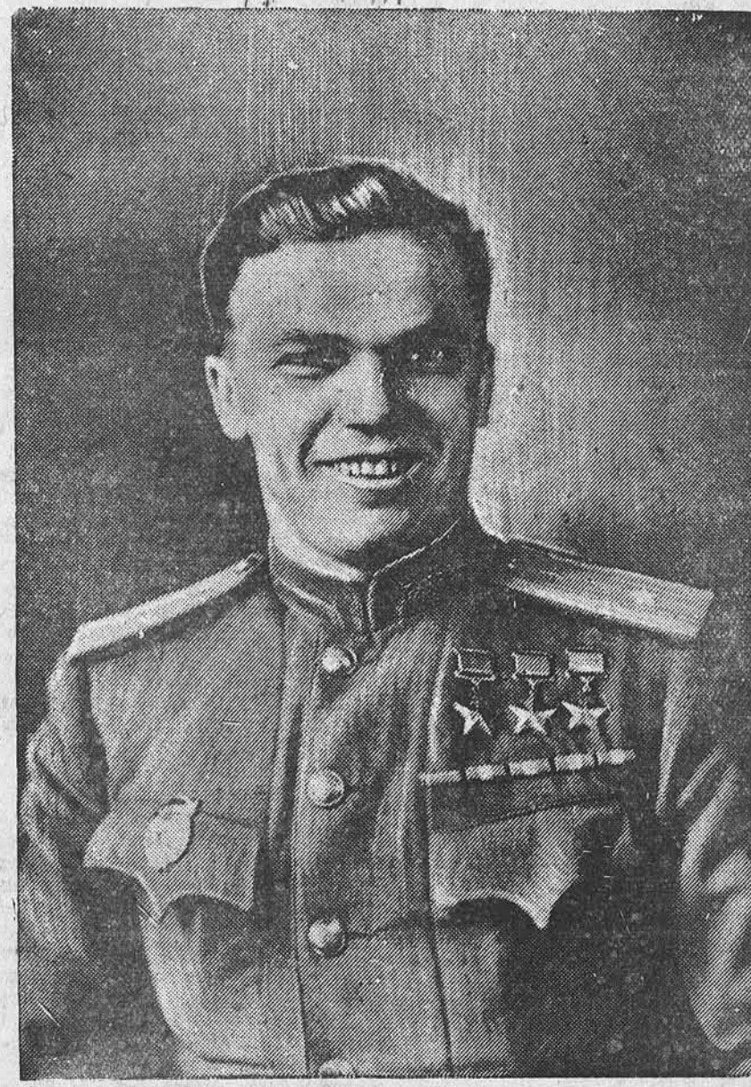
Трижды Герой Советского Союза гвардии майор ИВАН НИКИТОВИЧ КОЖУБЕВ.

«Шоса белый» нынче плодоносил впервые. Несмотря на суровые климатические условия, он оказался зимостойким и дал замечательный урожай — до пяти и более килограммов плодов с одного куста.