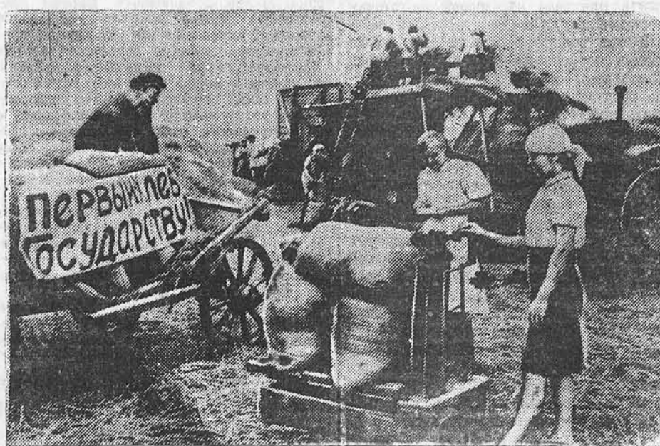
На току колхоза «Единство», Ефремовского района, Тульской области. НА СНИМКЕ: взвешивание зерна, отправляемого на государственный сыпной пункт.

Обязательства обещаны и приняты на собраниях работников автоотрядов и