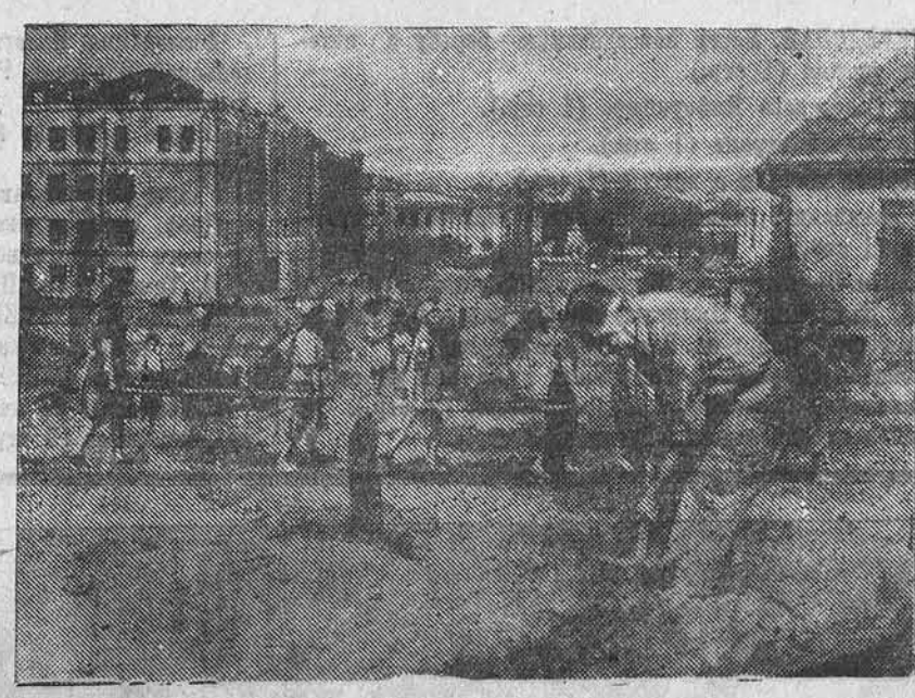
Восстанавливается и благоустраивается Ворошиловград. НА СНИМКЕ: жители города на работах по благоустройству улицы имени Ленина.

После предварительных испытаний аэростат из Петербурга, где в зоологическом саду производились первые подъемы, был похолодным порядком перевезен в Усть-Ижорский сапёрный лагерь. Там с 28 июля по 1 августа (старого стиля) 1870 г. были произведены первые подъемы непосредственно в войсковой части. День окончания работ комиссии 1-е августа (13 августа по новому стилю) 1870 года и принято считать датой зарождения русского военного воздухоплавания.