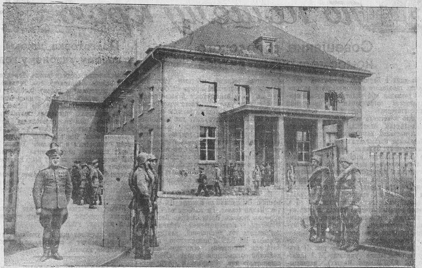
К подписанию 8 мая 1945 года в пригороде Берлина — Карлсхорсте акта о безоговорочной капитуляции германских вооружённых сил. НА СНИМКЕ: дом в пригороде Берлина — Карлсхорсте, в котором был подписан акт о безоговорочной капитуляции германских вооружённых сил.