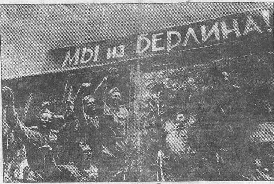
10 июля из Берлина отправился первый эшелон с демобилизованными из Красной Армии и возвращающимися на родину советскими бойцами. НА СНИМКЕ: группа бойцов-героев боёв за Берлин.

Лишь за четыре минуты до конца игры команда ЦДКА получила право на штрафной 11-метровой удар, и Демин избавил свою команду от «сухой». Газзель, игра вполна. Но динамовцы ринулись на ворота противника, и Бесков, красивым и точным ударом, довел счет до 4:1.