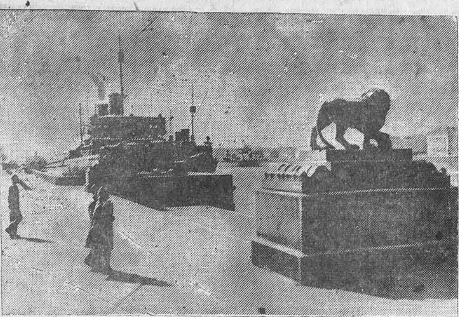
Ленинград сегодня. На набережной Невы.

Крайконторе Главнаба Наркомтяжмаша — в производную и ночные сторожа, возчики, товароведы, кассир, экономист, гильевики, сапожники, малятники. Снабжение через ОРС, обеспечиваются спецодеждой. Обращаться: ул. Королёно, 109.