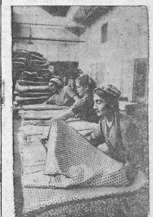
На Ташкентском текстильном комбинате начали выпускать новый ассортимент тканей. НА СНИМКЕ: просмотр новых тканей.

По решению Совнаркома Белорусской ССР в Минске будет построен завод минеральной ваты мощностью 2 тысячи тонн.