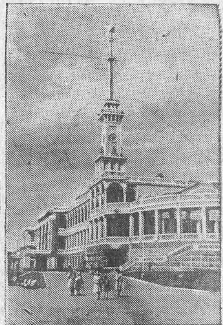
Химкинский речной вокзал в г. Москве.