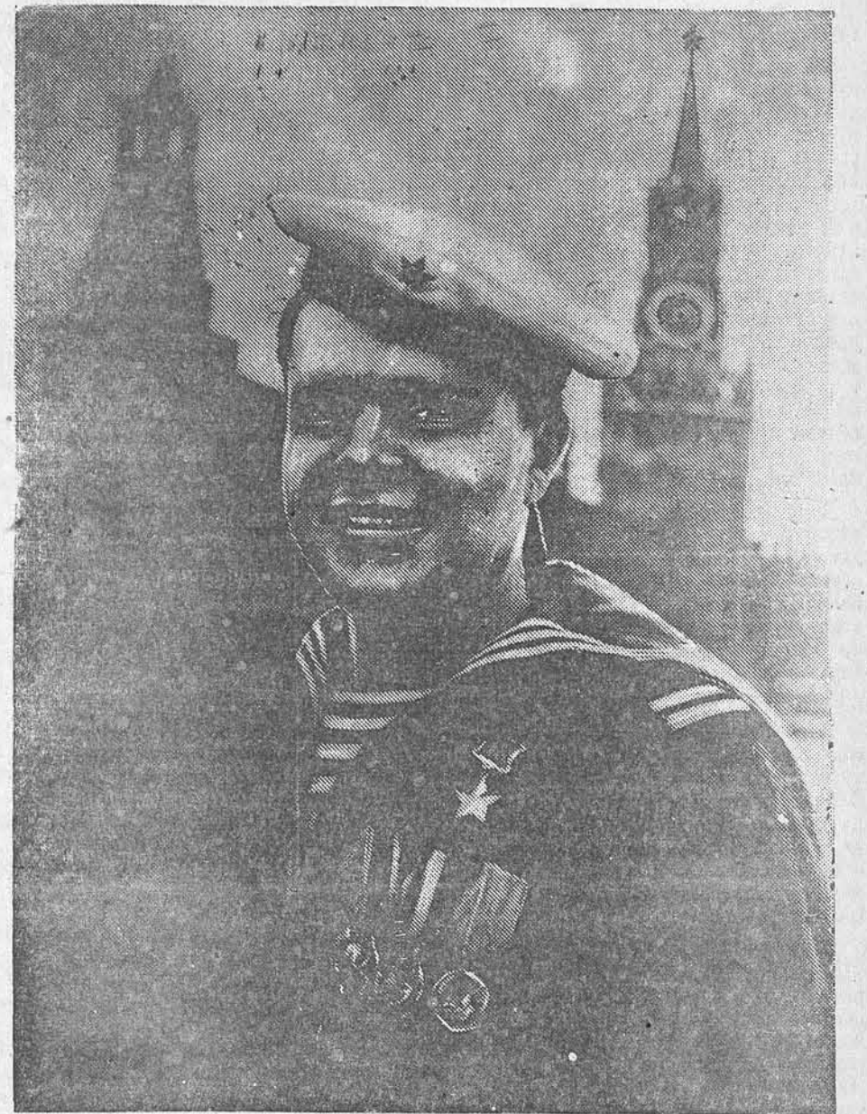
Много славных дел совершил в боях за Родину разведчик Краснознамённого Балтийского Флота старшина второй статьи Владимир Дмитриевич Фёдоров. Указом Президиума Верховного Совета Союза ССР ему присвоено звание Героя Советского Союза. До войны тов. Фёдоров учился в 501-й школе Пролетарского района г. Москвы.

В следующем году в МГУ предполагается принять 1715 человек: на филологический факультет — 300, физический — 300, исторический — 180, механико-математический — 150, химический, географический и геолого-почвенный факультеты — по 125, биологический — 120, философский и юридический — по 100 и экономический — 90 человек. Руководители государственных, кооперативных и общественных предприятий, организаций и учреждений обязаны предоставлять лицам, допущенным к приёму на испытания в вуз, отпуск без сохранения заработка на период этих экзаменов с учётом времени, необходимого для проезда в учебное заведение и обратно. Принятые в высшие учебные заведения должны быть освобождены от работы за 10 дней до начала учебных занятий. Поступающим в вузы органы милиции обязаны беспрепятственно выдавать пропуск на выезд по вызову директоров учебных заведений. (ТАСС).