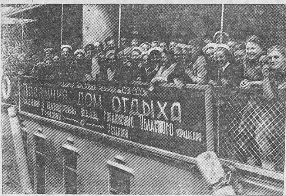
В этом году 1400 воспитанников ремесленных и железнодорожных училищ Горьковской области — отличников учёбы — проведут каникулы в пловучем доме отдыха, курсирующем по Волге между Горьким и Астраханью. НА СНИМКЕ: на палубе совершающего первый рейс пловучего дома отдыха в момент подхода к Сталинградской пристани.