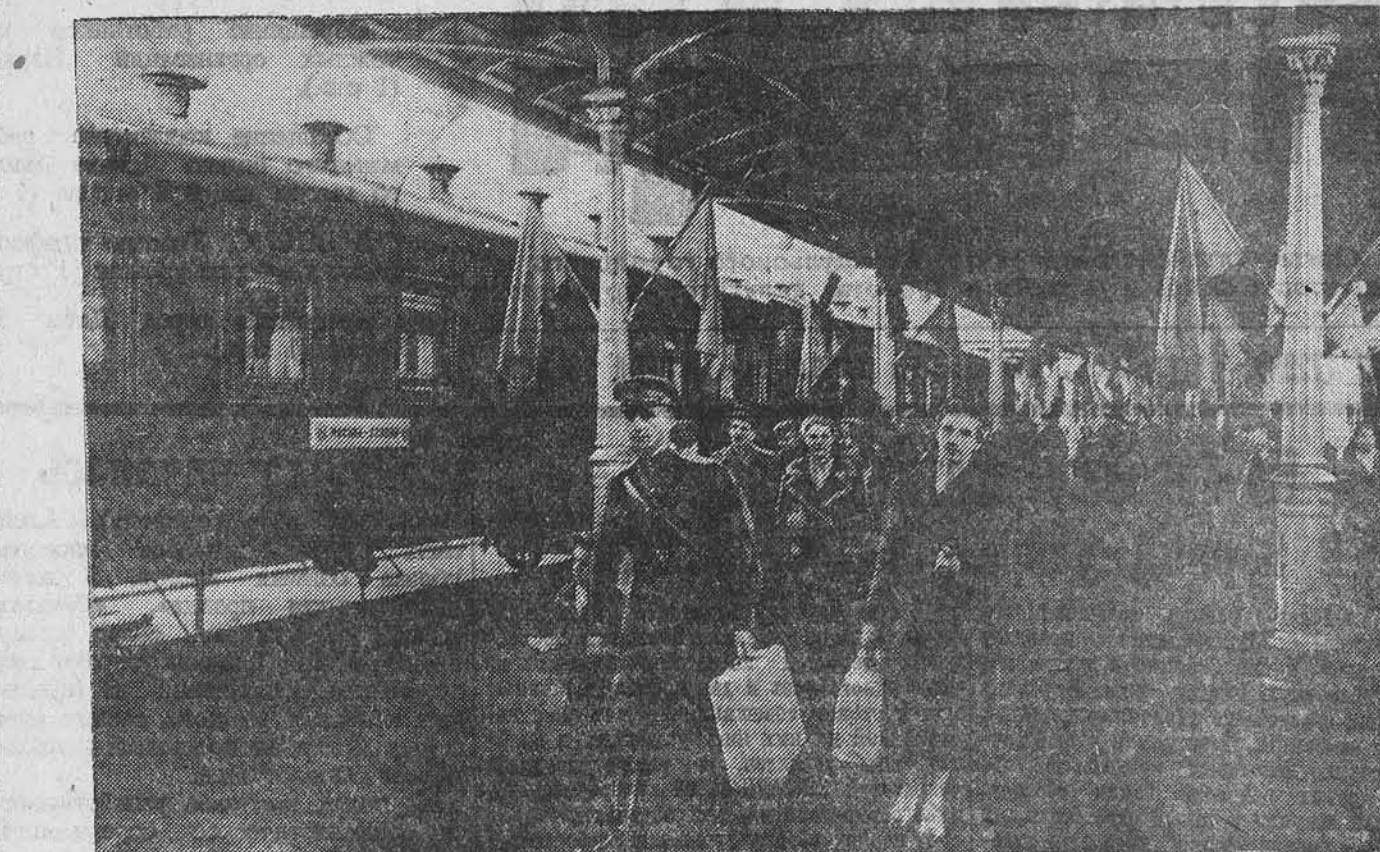
25 июня, в 2 часа дня, с Белорусского вокзала отправился первый поезд Москва-Берлин. В составе поезда идет вагон-кино, вагон-ресторан, парикмахерская. Поезд радиодифференцирован. НА СНИМКЕ: на перроне вокзала перед отправлением поезда.

Более половины районов Ставропольского края приступили к массовой уборке хлебов. Сотни колхозов начали поставки хлеба государству. Заготовительные пункты края уже приняли от колхозов около 200 тысяч пудов хлеба нового урожая. (ТАСС).