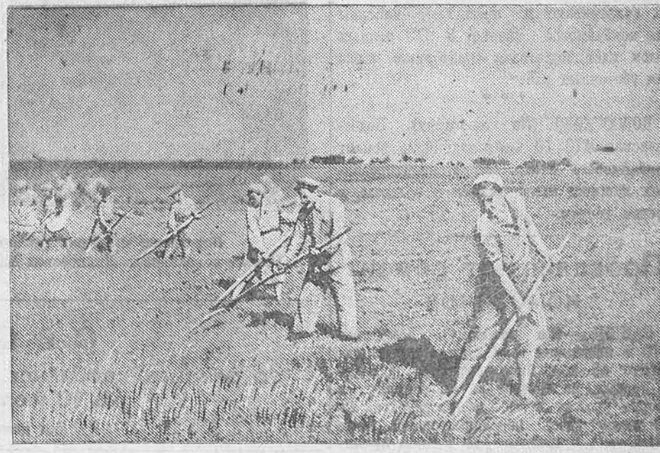
Сенокос в колхозе «Красный хлебороб», Гомельского района, Белорусской ССР.

На аэродроме гостей встречали заведующий Международным отделом ВЦПС М. И. Кузнецов, председатель ЦК профсоюза рабочих чёрной металлургии М. Е. Евстратов, Заместитель Народного Комиссара чёрной металлургии А. Г. Шереметьев, ответственные работники ВЦПС, представители советской прессы. (ТАСС.)