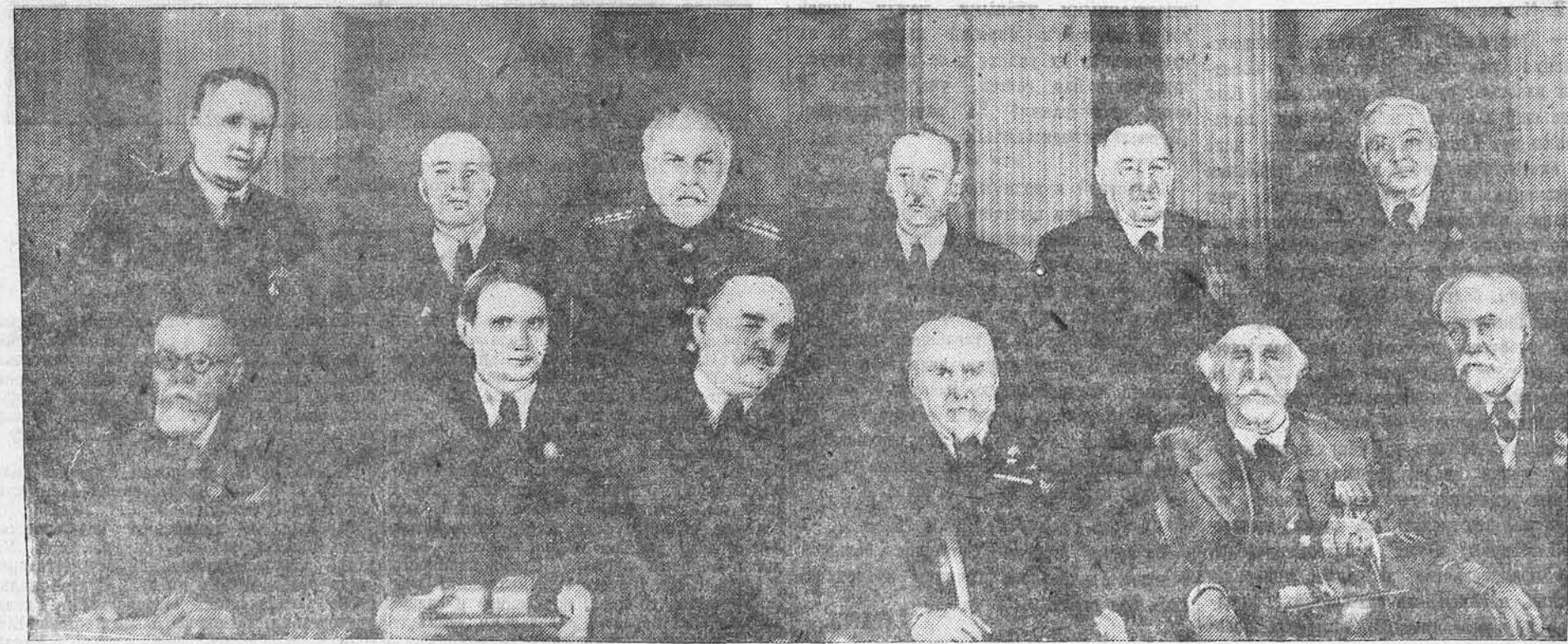
14 июня Первый Заместитель Председателя Президиума Верховного Совета СССР тов. Н. М. Шверник вручил ордена награжденным академиком. НА СНИМКЕ (слева направо): в первом ряду — Герои Социалистического Труда академики М. А. ПАВЛОВ и Т. Д. ЛЫСЕНКО, тов. Н. М. ШВЕРНИК, Герои Социалистического Труда академики В. Л. КОМАРОВ, И. Д. ЗЕЛИНСКИЙ и Д. Н. ПРЯНИШНИКОВ; во втором ряду — Герои Социалистического Труда академики И. П. БАРИН, И. М. ВИНОГРАДОВ, Л. А. ЮРБЕЛИ, И. И. МЕЩАНИНОВ, А. И. АБРИКОСОВ и А. А. БАЙКОВ.