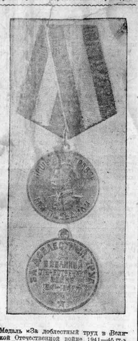
Медаль «За доблестный труд в Великой Отечественной войне 1941—45 гг.».

С 10 по 25 июня в районе проведен комсомольский рейд по проверке готовности в плане колхозных скотных дворов. Там, где требуется ремонт этих помещений, по инициативе комсомольцев организованы строительные бригады.