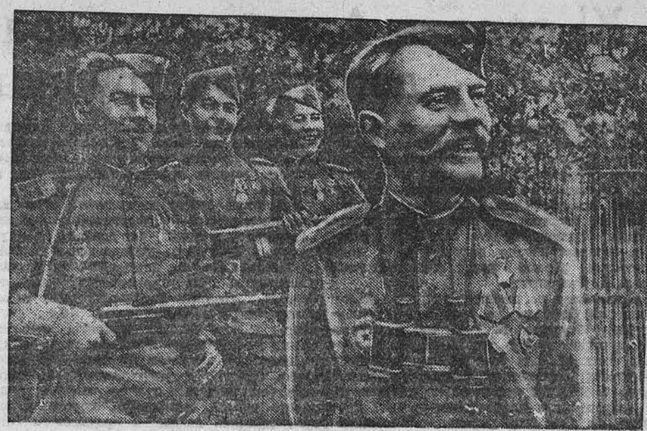
Действующая Армия. (1-й Украинский фронт). Эти бывшие воины — Герои Советского Союза — уничтожили за время войны 690 гитлеровцев.

В ФИНСКОМ заливе наши войска полностью очистили от противника острова КОЙВИСТА и ТИУРИН — САРИ. На других участках фронта — без перемен.