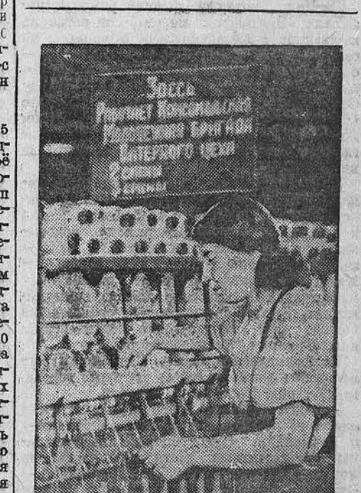
На Калининской предлинной фабрике хлопчатобумажного комбината «Пролетария».

Бумажки вместо дела ЗОНАЛЬНОВ. (По телефону от нашего соб. корр.) Пролёт месяц со дня опубликования постановления Крайкома ВКП(б) и крайисполкома о заготовке кормов для животноводства. А в домодела Зонального района реагирует на это постановление только сейчас, и то очень своеобразно. Районом посылает в колхоз одну за другой формальные бумажки о необходимости заготовки кормов. Но все эти запоздалые напоминания мало помогают делу. Колхозам района необходимо заложить 7.000 тонн силоса, скошен трав на сено на площади 300 тысяч гектаров. Ясно, что подготовиться к этому мероприятию надо было заблаговременно. Но в то время, как в соседних районах уже активно приняты за сенокосение и илодосование, в Зональном районе создавалась шумиха о подготовке сенокосения, колхозных бригад и другого сенокосоточного инвентаря. Отсутствие планомерной работы привело к плачевным результатам. Из 216 сенокосилок на сегодняшний день отремонтировано только семидесят семь. К сенокосу колхозов ещё совсем не приступили.