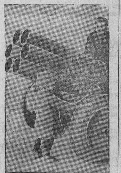
В краевом музее. Юные посетители с интересом осматривают трофейное оружие, захваченное Красной Армией у немецких оккупантов.