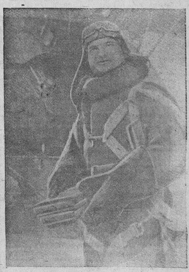
Действующая Армия. Знаменитый снайпер Герой Советского Союза гвардии старшина Николай ИЛЬИН, истребивший 459 немецких солдат и офицеров и подготовивший свыше 70 снайперов.