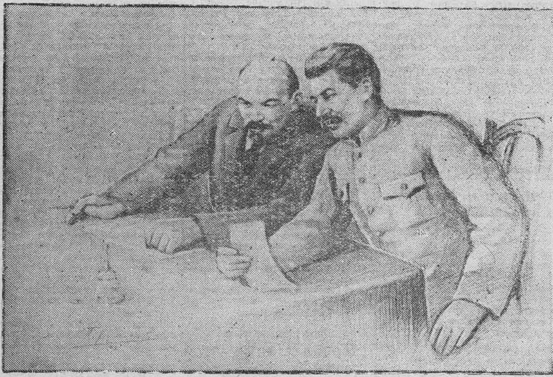
Ленин и Сталин.

В свете Великой Отечественной войны наглядно определилось значение сталинских пятилеток. Вторая металлургическая база на Урале, промышленное строительство в Сибири, Средней Азии и в других районах страны — то, о чём говорил Ленин, наш народ осуществил под руководством товарища Сталина. С гениальной прозорливостью великий вождь народов СССР товарищ Сталин