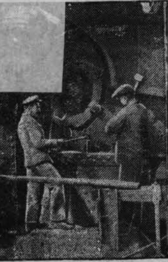
В освобождённом Донбассе. Восстановление Енакиевского металлургического завода. Ремонт доменной печи.

Сегодня перевеса программы II цикл иллюзионного аттракциона КЛЕО ДОРОТТИ Большая церковная программа в 3-х отд. Начало в 8-30 вечера.