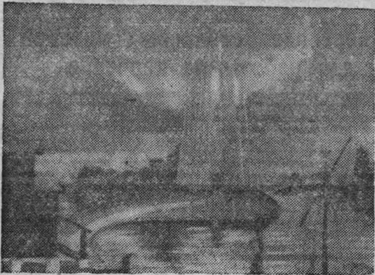
Кадр из фильма «Конец Кошечки Бессмертного», снимаемого в с. Озерках, Барнаульского сельского района.