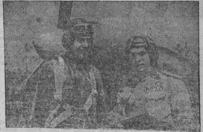
Действующая Армия. Герой Советского Союза, гвардии старший лейтенант Н. Г. Китаев (справа), сбивший лично 16 вражеских самолетов и 8 в групповых боях, и летчик-истребитель гвардии старший лейтенант И. И. Семеников, сбивший лично 7 вражеских самолетов и 8 в групповых боях.