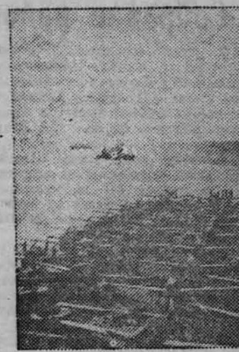
Вооружённые силы США. НА СНИМКЕ: американский авианосец прибыл на одну из баз. Самолёты заправляются перед перелётом на сушу.

прекращение операций германской авиации над Англией объясняется отвлечением германских воздушных сил на восточный фронт, недостатком у немцев запасных частей и горючего, истраченного в битве за Рур и стремлением противника сохранить свои воздушные силы в связи с ожидаемым вторжением союзников.