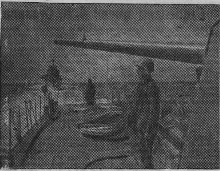
Черноморский флот НА СНИМКЕ: корабль в боевом походе. На переднем плане у орудия на вахте краснофлотец Е. Голубев.